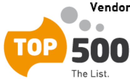
Vendors System Share